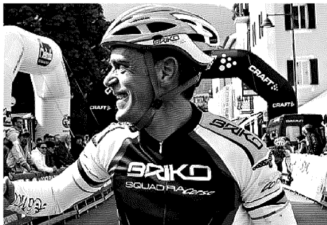
Pietro Piller Cottrer, qui in versione ciclista

Non era mai successo che gli aspiranti consiglieri fossero addirittura due: «Questo significa che siamo una provincia vivace e piena di voglia di essere rappresentati a livello nazionale. Sono contento che ci sia anche Piller Cottrer, un atleta che può ancora dare molto sui campi di gara. Sono sicuro che andrà avanti, dopo l'infortunio, che ha patito alla Marcia-longa».