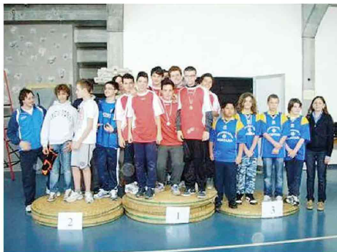
I finalisti della gara al Palacus

GUARDA SUL SITO LE IMMAGINI DELLA GIORNATA www.laprovinciapavese.it