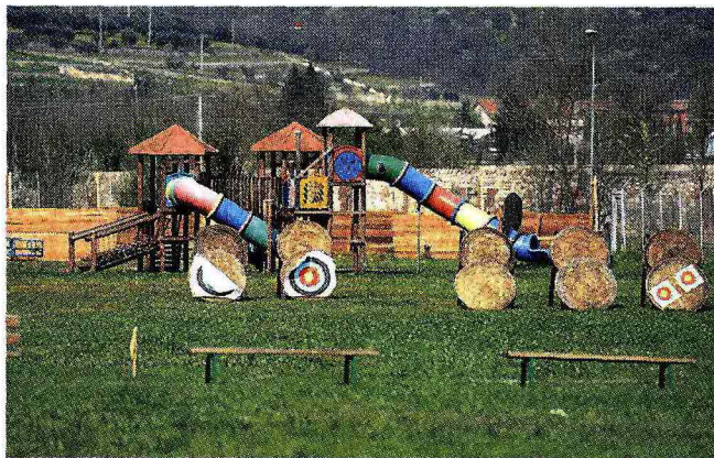
I bersagli del tiro con l'arco e, dietro, i giochi per i bambini