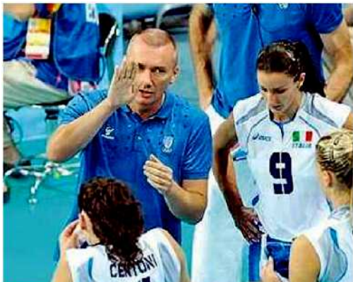
Il coach Massimo Barbolini

«Il titolo di "Città Europea dello Sport" - sottolinea Antonino Marino assessore allo Sport del comune di Modena - è il riconoscimento più prestigioso per i Comuni dell'Unione Europea che intendono lo sport come un'opportunità di strategia sociale».